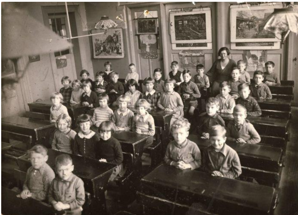
Klassenfoto van een eerste klas (tegenwoordig groep 3), omstreeks 1910

Laat de leerlingen naar de volgende foto kijken (klik hier voor een vergroting):