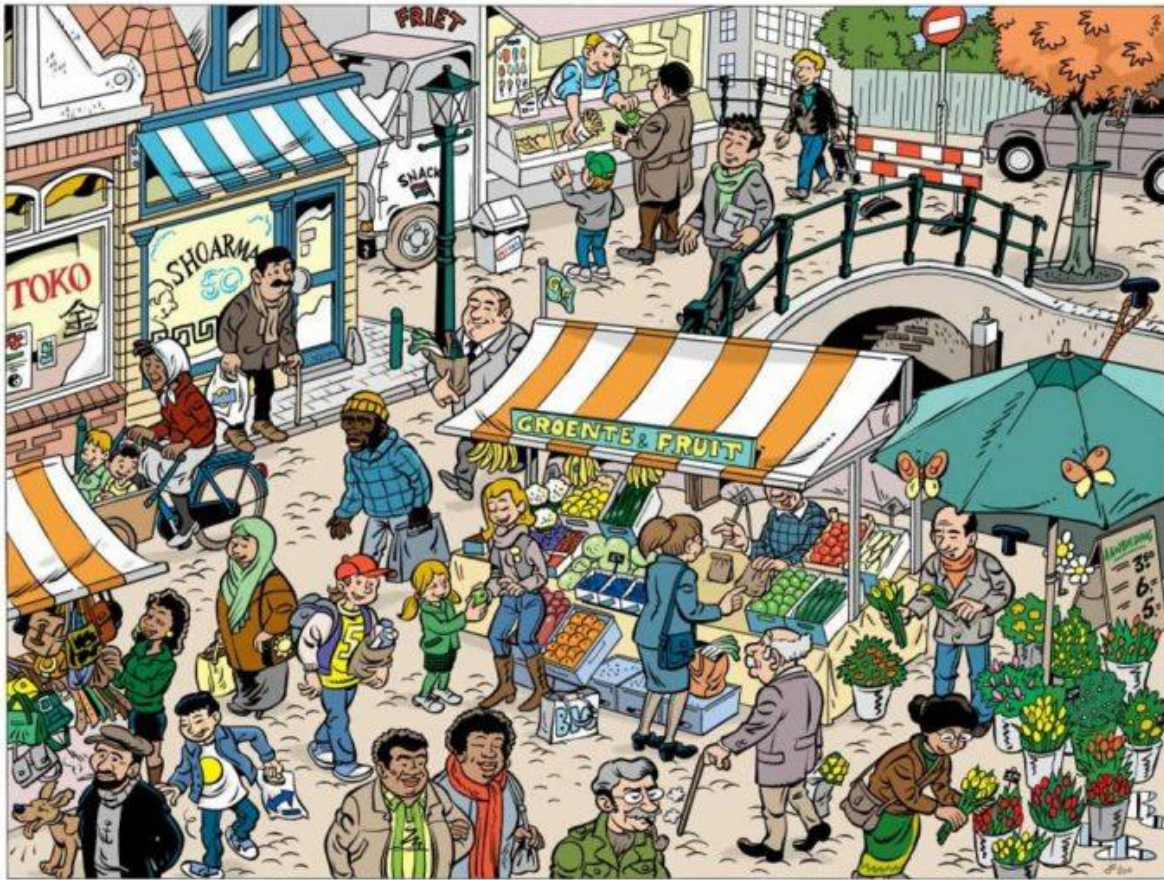
Veelkleurige Vertelplaat