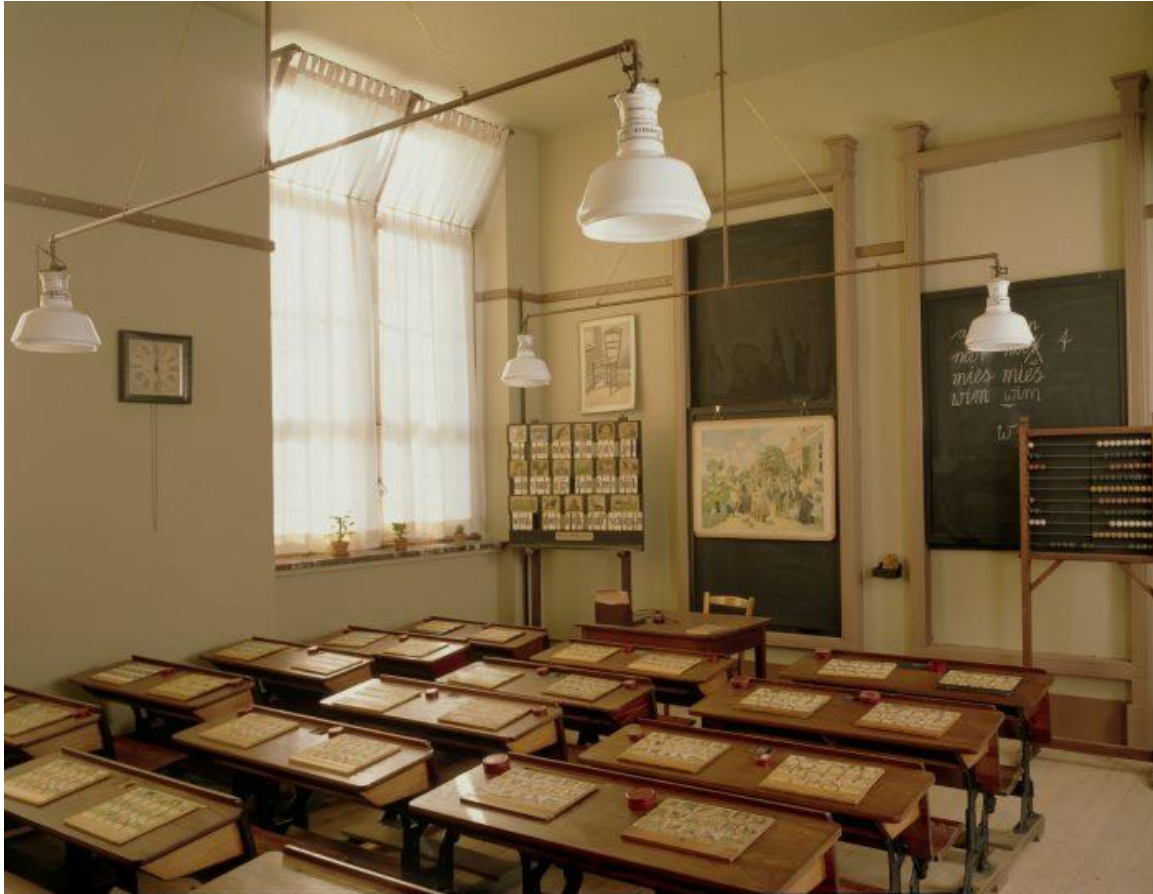
Klaslokaal omstreeks 1910 Collectie nationaal Onderwijsmuseum, Dordrecht

Ga naar aanleiding van de besproken stellingen nog kort met de kinderen in gesprek. Wat vinden ze van de school van vroeger? Wat is het grootste verschil met de school van nu? Wat vinden ze ervan dat jongens en meisjes vroeger aparte vakken kregen? En wat zouden ze ervan vinden als juffen of meesters bij straf nog steeds zouden mogen slaan?